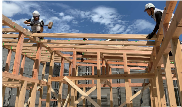
▲ 晴天の棟上げ(9月初旬)