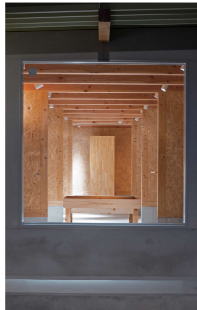
通りから店内が連なるようにみえる

良質なフルーツやお惣菜を取り扱われていることで有名な青果店さんが喫茶を併設した青果店を新たにオープンされました。