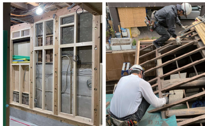
▲ 既存の壁を残し、基礎と骨組みを内側に設けて補強