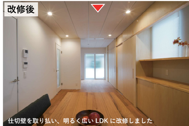
仕切壁を取り払い、明るく広いLDKに改修しました

築40年近い二階建て住宅の改修工事が完成しました。一度柱や梁の骨組の状態にして、耐力壁の位置を工夫して補強することにより、改修前よりも壁の少ない住空間になりました。