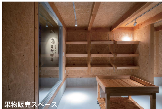
果物販売スペース