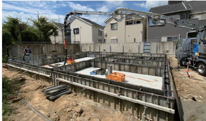
▲ 精度の高い鋼製の型枠を用いた基礎工事