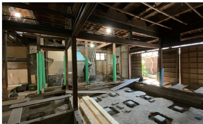
▲ 骨組みだけを残した解体後の様子

熟練大工さんの技術を継承しつつ、愛着をもって家を住み継いでいくという選択肢を弊社は全力でサポートします！