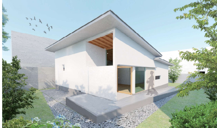
▲ 完成予想の外観イメージパース

手間を惜しまない自社大工工務店として、性能が高く、健康に良いZEHにも力を入れていきたいと思います。