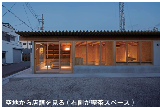
空地から店舗を見る（右側が喫茶スペース）